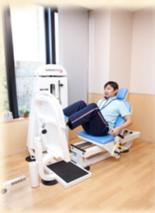
レッグプレス (下半身の運動)