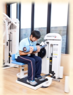
トーンフレクション (腹筋運動)