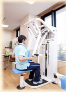
ローイング (上半身の運動)