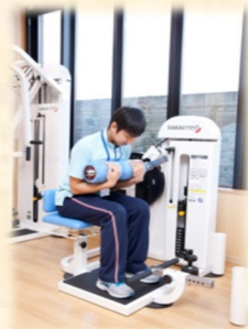
トーンフレクション (腹筋運動)