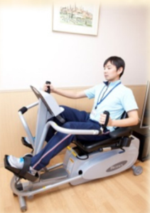
バイオステップ (有酸素運動)

体力・筋力・体重をもとに、適切な負荷の設定で4種類のマシンに取り組んでいただきます。運動指導員が、正しいフォームで行えるようにサポートいたします。