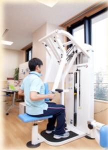
ローイング (上半身の運動)