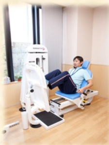
レッグプレス (下半身の運動)